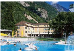
Fra kurstedet Les Bains de Lavey

Det daglige kursusprogram består af ca. 3 timer om formiddagen fra kl. 9.15 til 12.15 og ca. 2½ time om eftermiddagen fra kl. 15.00 til ca. 17.30. I den mellemliggende tid vil der være rig mulighed for at nyde bjergene, solen, og den smukke natur.